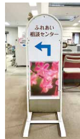
正面玄関入ってすぐ左側 この看板が目印

〒441-3422 愛知県田原市赤石2-2 田原福祉センター1階 (田原市社会福祉協議会内) 無料駐車場あり