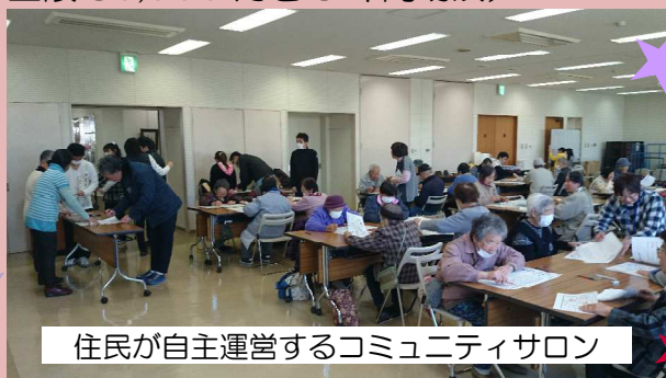
住民が自主運営するコミュニティサロン