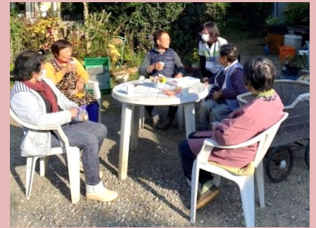
自主サロンの様子

高齢者の居場所づくりとして、市民が自主的にサロンを開設する場合、 立上げ支援として270,000円(8.7%)を助成。 (1サロン年間上限30,000円を3年間助成)