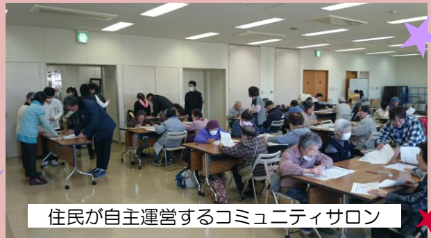
住民が自主運営するコミュニティサロン