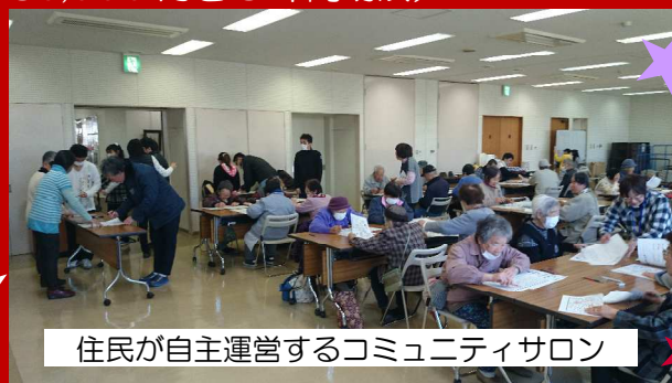
住民が自主運営するコミュニティサロン