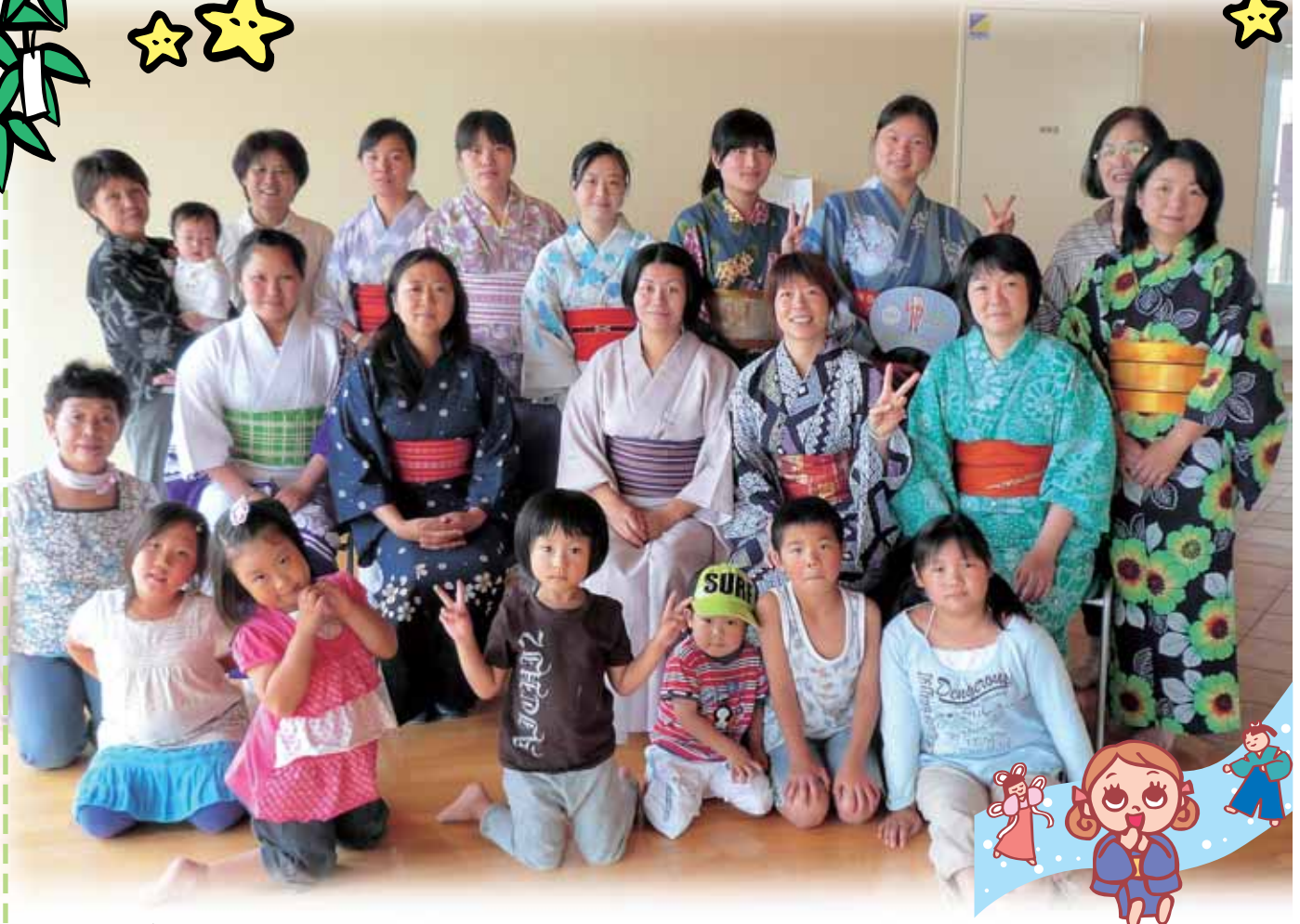
あかばね ひらがなの会の皆さん (みんなで浴衣の着付けに挑戦しました。)

No.1スマイルに掲載する皆さんの笑顔の写真を募集しています。 社会福祉協議会までお気軽にご連絡ください。