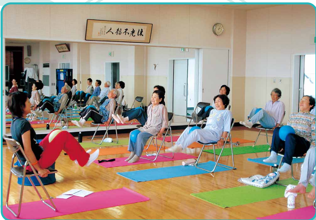
運動教室を楽しむみなさん