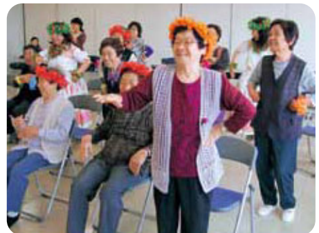
▲フラダンスを楽しむサロン参加者

ふれあいいきいきサロンとは「おしゃべりして、笑う。」ことによって、仲間や生きがい作りを目的に、子どもから高齢者まで誰でも無料で参加できる場所です。一緒にそばにいて、笑って寄り添っていただけるボランティアを募集しています。月1回の参加でも大丈夫ですので、ほんのちょっとお時間をいただけませんか?