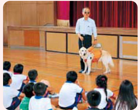
▲高松小学校では全校児童と交流しました。

今回の交流会を通じて、子ども達が視覚に障害のある方に町中で、自然と優しく声をかけられる一人の市民に育ってくださることを願っています。