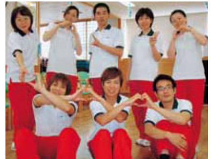
私たちと一緒に働きませんか？