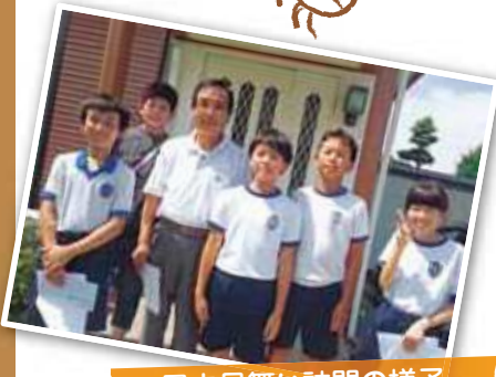
暑中見舞い訪問の様子

7月4日(月)、気温30度を超える暑さの中、10名の児童たちは3班に分かれて、26名の高齢者宅を訪問しました。手紙を手渡し、「お体に気を付けてください。」「市民館まつりでは私たちが演奏会をするので見に来てください。」等と声をかけると、高齢者たちは満面の笑み。 今の子どもたちは地域の大人と関わる機会が少なくなっていると言われる中、高松校区で続けられているこの活動は、地域の中で互いを思いやり、ともに生きる力をはぐくみ続けています。