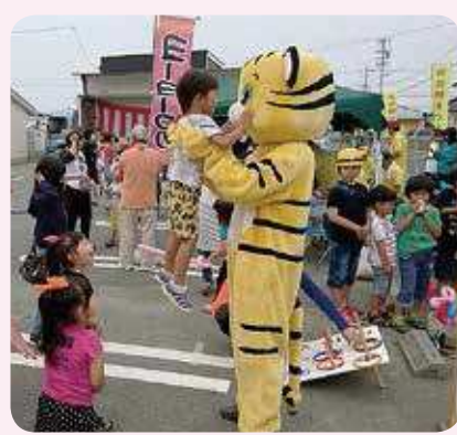
6月25日 清田市民館まつりの様子