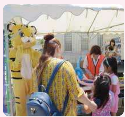
5月28日 童浦市民館まつりの様子