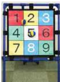
ターゲットゲーム