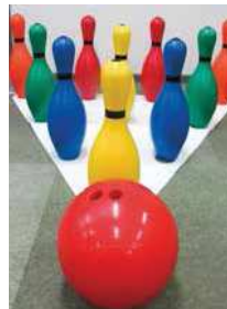
カラーボウリング