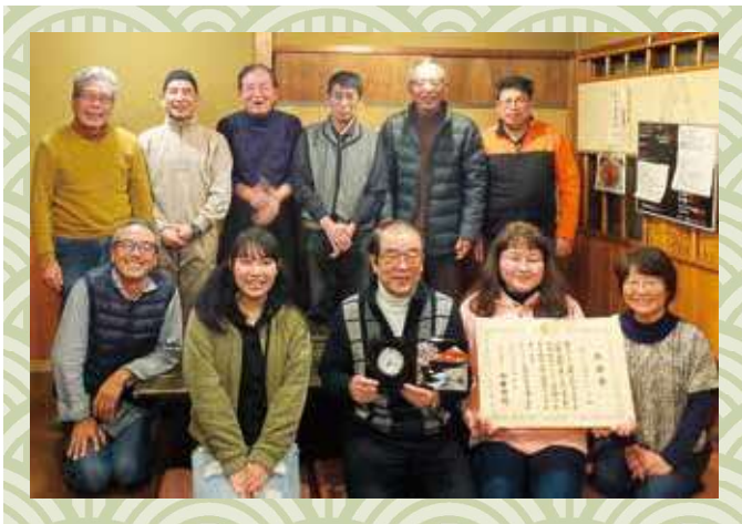
令和元年度全国社会福祉大会において 厚生労働大臣感謝状を贈呈された 『あいくるボランティア』の皆さん