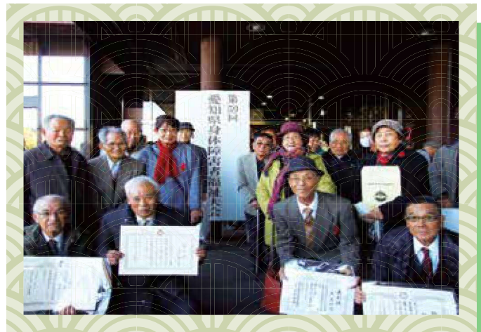
第59回愛知県身体障害者福祉大会において表彰された 『田原市身体障害者福祉協会』会員の皆さん