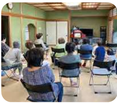
おうむ石の紙芝居

カフェ終了後の15時から30分程度、スタッフ会を始めました。七つ山カフェのお手伝いをしてきているボランティアと生活支援コーディネーターで、地域の様子や、5年後10年後の自分たちのことなど、今気になることを自由におしゃべりしています。