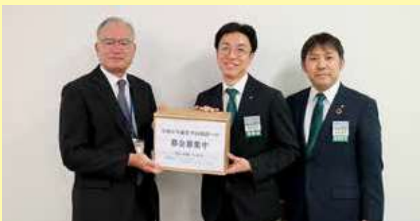
▲一般社団法人 田原青年会議所 様