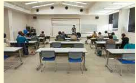
▲昨年度の講座の様子