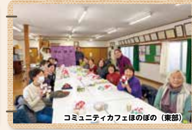
コミュニティカフェほのぼの (東部)