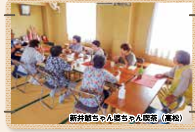
新井館ちゃん婆ちゃん喫茶 (高松)

今年度も地域の皆さまから、色々なお話を聞かせていただきました。次年度もサロンや教室、地域の集まり等に参加したいと考えていますので、「うちの集まりを見においでん!」という皆さまからのご連絡をお待ちしています。