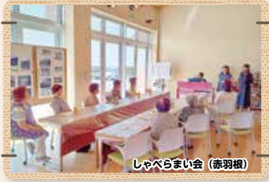
しゃべらまい会 (赤羽根)