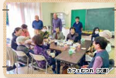
カフェむつれ (穴穂)