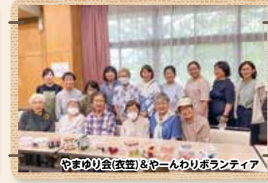
やまゆり会(衣笠)&やんわりボランティア