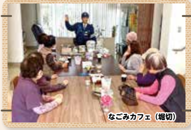
なごみカフェ (堀切)