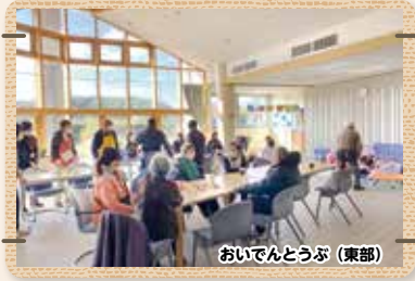
おいでんとうぶ (東部)