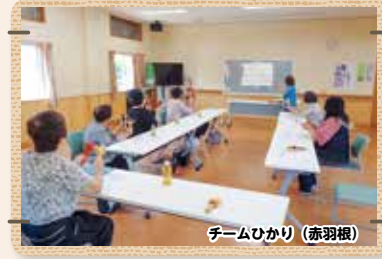
チームひかり (赤羽根)