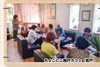
ちよこにご越戸カフェ (若戸)