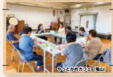
やっとかめカフェ (龜山)