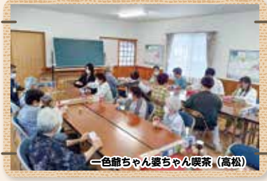
一色館ちゃん婆ちゃん喫茶 (高松)