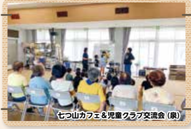
七つ山カフェ&児童クラブ交流会 (泉)