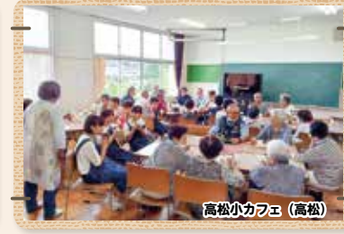
高松小カフェ (高松)